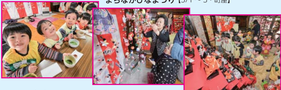
〔23〕平成29年4月1日・広報くずまき