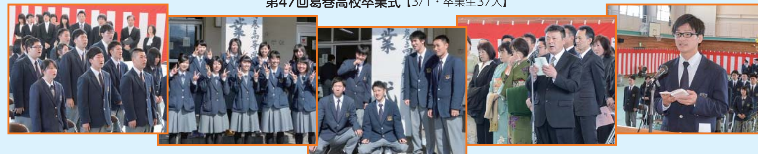
広報くずまき・平成29年4月1日〔22〕