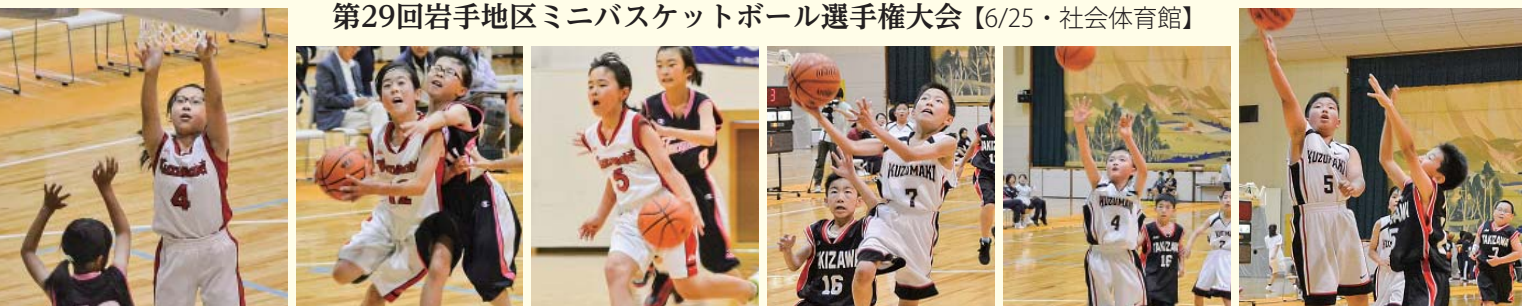
〔11〕平成28年7月1日・広報くずまき