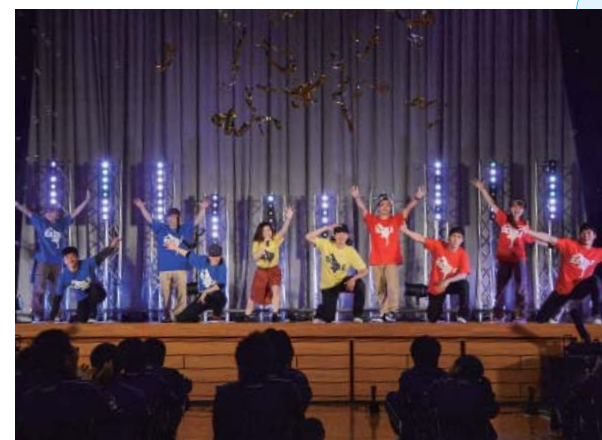
躍動感あふれるヒップホップダンス、華やかな照明、重低音が鳴り響く音響など、本格的なダンスステージに会場から大きな拍手が沸き起こった