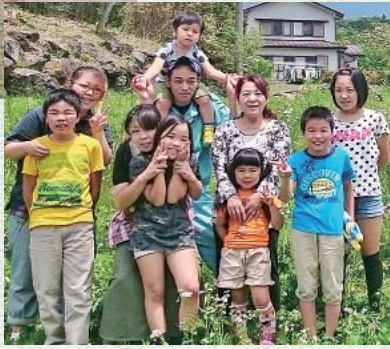
右から3番目がお本人