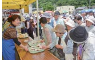
へっちょこだんご300食が無料で振る舞われた