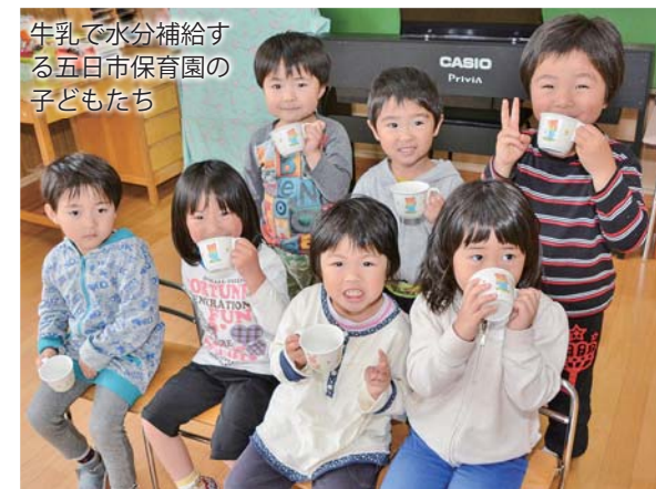
牛乳で水分補給する五日市保育園の子どもたち

▼ 暑さを避けましょう 暑い日は無理をせず、涼しく過ごせるよう工夫しましょう。また、通気性が良く、涼しい服装で熱を逃がすよう