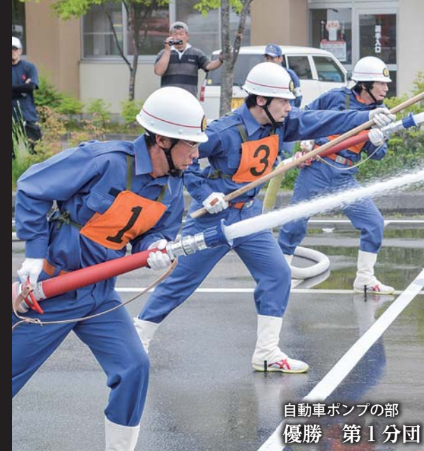
自動車ポンプの部 優勝 第1分団