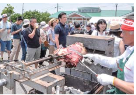
終始行列が絶えなかった、くずまき高原牛の丸焼きコーナー