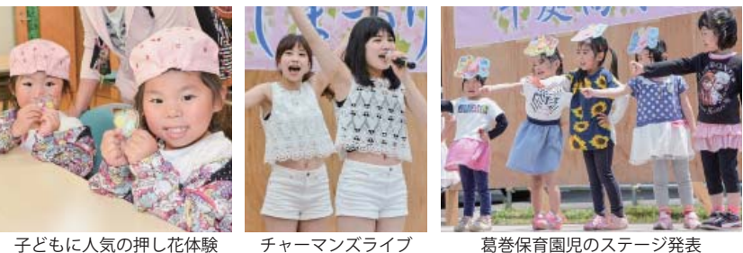
子どもに人気の押し花体験 チャーマンズライブ 葛巻保育園児のステージ発表