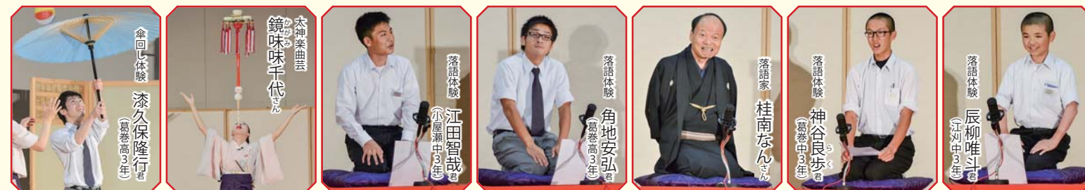
広報くずまき・平成28年7月1日〔10〕