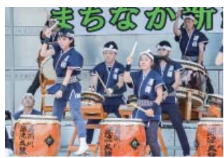
力強い演奏が会場いっばいに鳴り響いた馬淵川源流太鼓