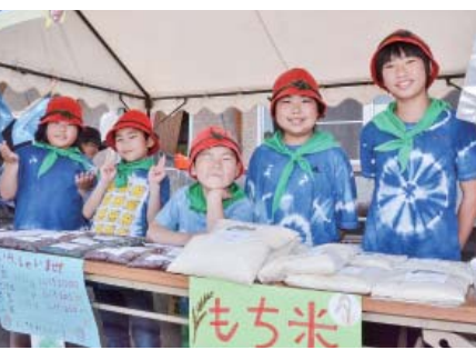
自分たちで藍染めしたTシャツや野菜などを元気に販売した吉ヶ沢小の児童