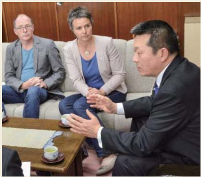
町長室で鈴木重男町長から町の概要説明を受けるフリュント知事（中央）

ドイツのマールブルク=ビーデンコップフ郡のキルステン・フリュント知事と職員ら6人が、5月25日から28日まで、本町のクリーンエネルギー施設や第3セクターなどを視察するため来町しました。