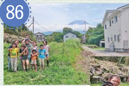
自宅前にて家族と

7/7(木) ※全血献血…400ml 献血 10時～12時 畜産開発公社 14時～16時 役場玄関前 今後の献血日程 10月22日(土) 町民まつり(社会体育館) 3月10日(土) 畜産開発公社、役場 健康福祉課 ☎66-2111 内線156