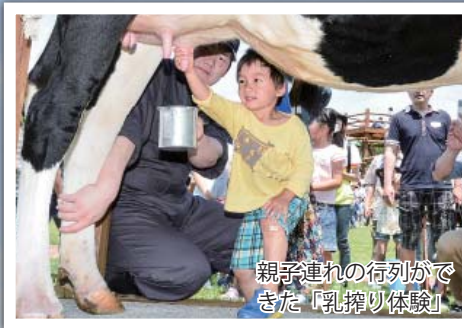
親子連れの行列ができた「乳搾り体験」