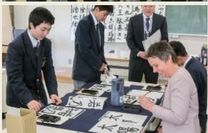
葛巻高校を訪問。昨秋、欧州視察に参加した生徒らと再会し交流を深めた④ 授業見学を行い知事も書道に挑戦