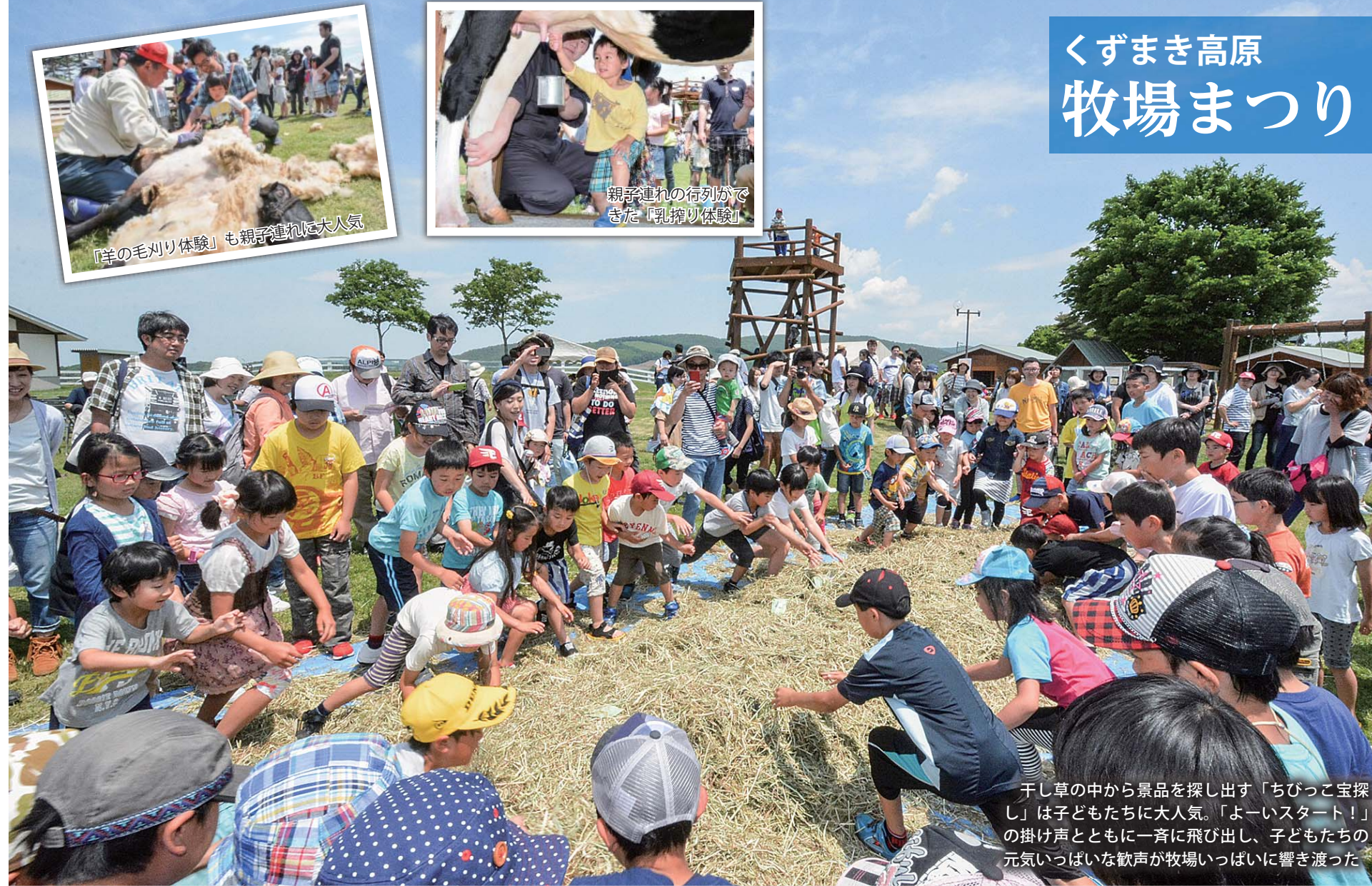
干し草の中から景品を探し出す「ちびっこ宝探し」は子どもたちに大人気。「よいスタート！」の掛け声とともに一斉に飛び出し、子どもたちの元気いっばいな歓声が牧場いっばいに響き渡った