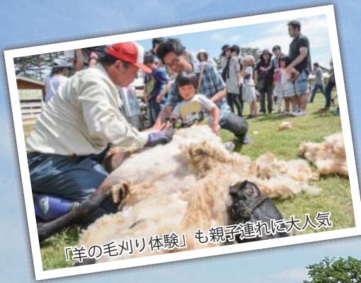
「羊の毛刈り体験」も親子連れに大人気