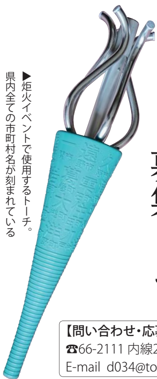
▶炬火イベントで使用するトーチ。県内全ての市町村名が刻まれている

【問い合わせ・応募先】教育委員会 ☎66-2111 内線275 / FAX 66-4389 E-mail d034@town.kuzumaki.iwate.jp