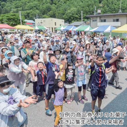
恒例の商品券入りのお菓子まきが集まる大勢の来場者