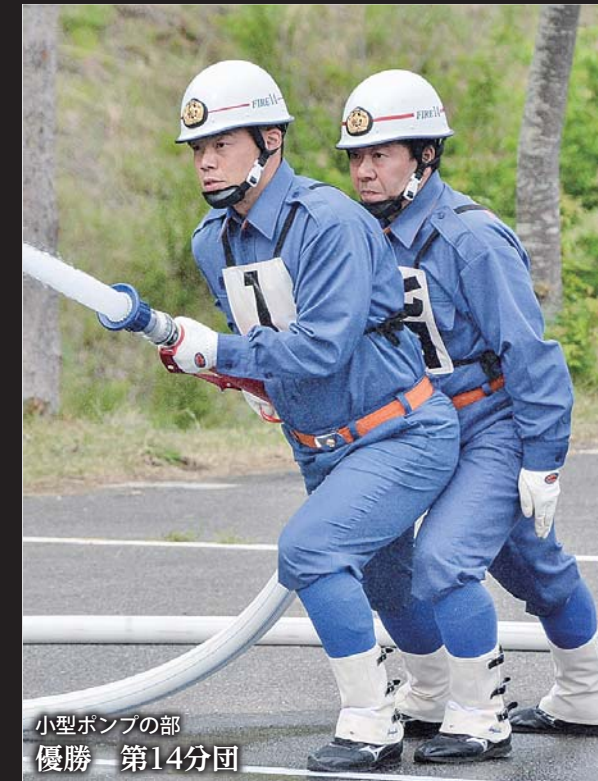
小型ポンプの部 優勝 第14分団