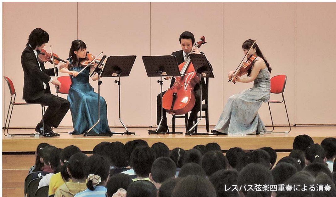
レスパス弦楽四重奏による演奏