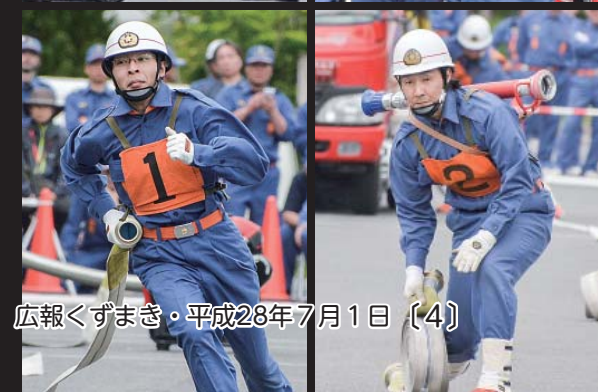
広報くずまき・平成28年7月1日 〔4〕