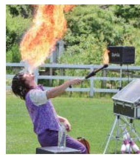
会場を盛り上げた大道芸の大技「火吹き」