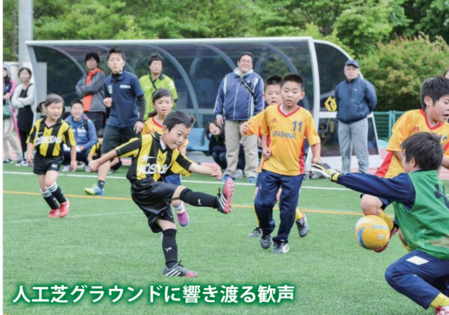
人工芝グラウンドに響き渡る歓声