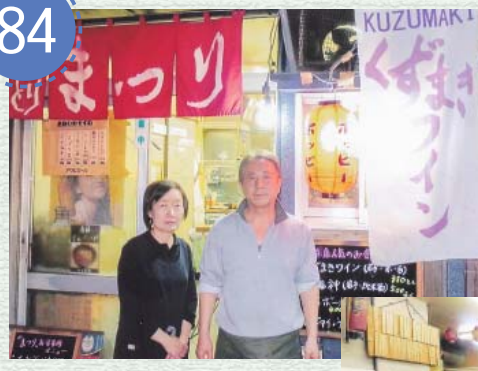
◀経営する焼き鳥店の前で妻と (東京都東村山市秋津町)