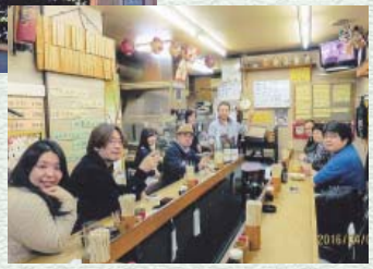
▼店内でお客さまと