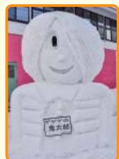
下町町内会「ゲゲゲの鬼太郎」