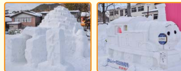
第3セクター「イグルー」