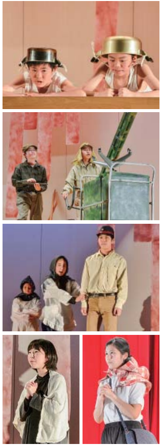
▼葛巻小6年生が役になりきって演じた「たなびく想い」