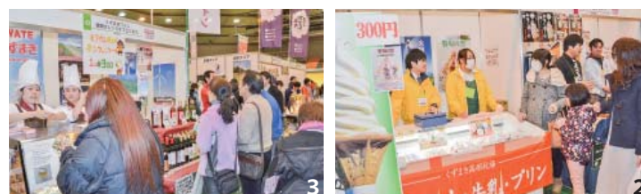
1 カステラやかりんとうなど葛巻ならではの菓子が人気を集めた吉澤菓子店 2 ソフトクリームやプリンなどが人気のくずまき高原牧場 3 ワインのほか葛巻産の牛乳とチーズを使用したシフォンケーキが好評だったくずまきワイン