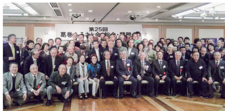
懇親会終了後、出席者全員で記念撮影