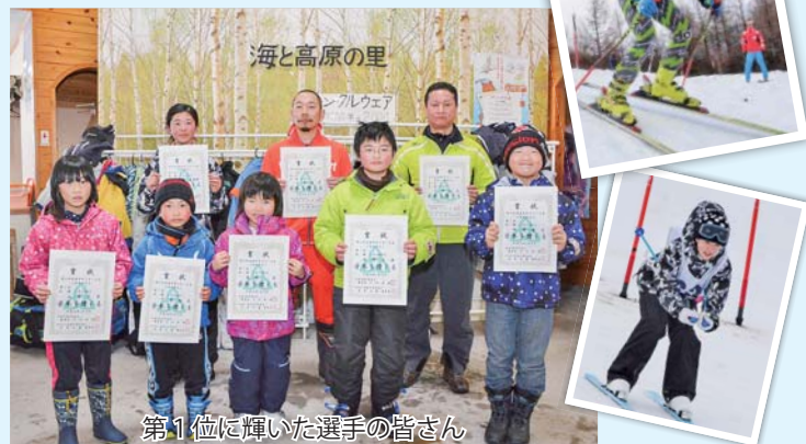
第1位に輝いた選手の皆さん

小学生から一般までの26人が参加。時折、降雨と強風が吹く悪天候の中、年齢別、男女別に大回転でタイムを競いました。競技の結果、第1位入賞者は次のとおりです(敬称略)。