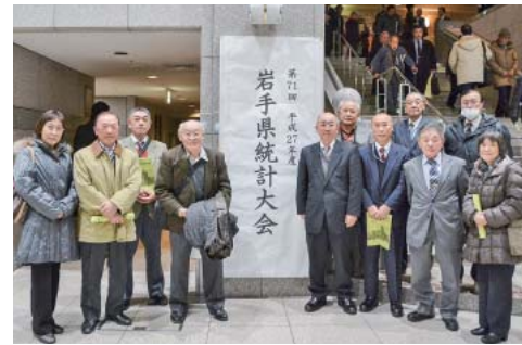
県統計大会に参加した統計調査員の皆さん

第71回県統計大会(県など主催)が2月4日、盛岡市民文化ホールで開催され、県内市町村の統計調査員ら約900人が出席しました。