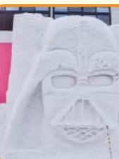
役場「ダース・ベイダー」