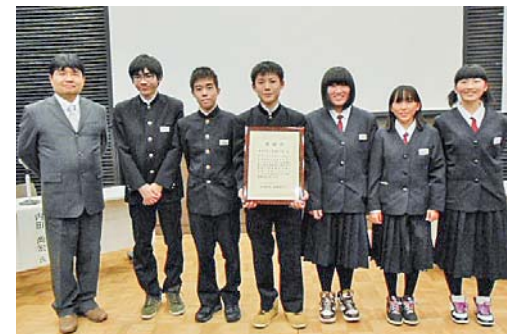
知事感謝状の贈呈を受け笑顔の小屋瀬中生たち

同校は、平成9年から地域の希少動植物である「サクラソウ」「カワシンジュガイ」「モリアオガエル」についての調査や保護などの環境ボランティア活動を実施。小屋瀬小学校や葛巻高校とも連携しながら取り組み、文化祭などで活動報告を行うなど環境保全意識の高揚に大きく貢献しています。