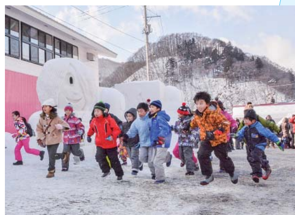
大勢の子どもが参加した「雪中宝さがし」。宝を目指して勢い良くスタートを切る子どもたち