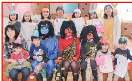
〔11〕平成28年3月1日・広報くずまき