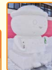
浦子内町内会「そばっち」