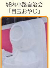
城内小路自治会「白玉おやじ」