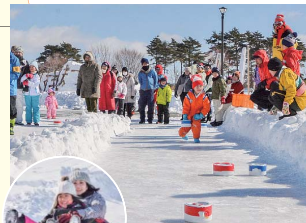
好天の下、氷上カーリング大会④とタイヤチューブロング滑り台を楽しむ親子連れ

第8回くずまき高原牧場冬まつりは2月6日から7日まで、同牧場で開催され、多くの来場者でにぎわいました。「全てが家族で楽しむ体験型冬まつり」をテーマに、雪を利用した体験型コーナーが数多く設けられました。タイヤチューブロング滑り台やスノーモービルでは、子どもたちが寒さを忘れて遊び、牧場の風を満喫。焼き肉を提供したアイスハウスレストランも人気を集めました。恒例の雪中綱引き大会や氷上カーリング大会、雪盛り上げ大会、雪中宝さがしには、町内外から多くの親子連れなどが参加。雪に触れ、思いっきり遊ぶ子どもたちの歓声が牧場いっぱいに響き渡りました。