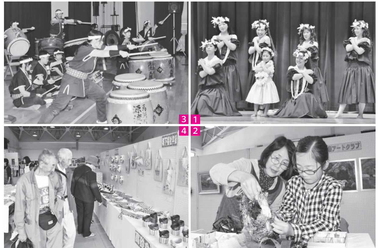
1 笑顔あふれるKanaloa hula葛巻教室のステージ発表 2 木の実をふんだんに使用したクリスマスリース作り 3 迫力ある太鼓を披露する馬淵川源流太鼓の会 4 展示作品に見入る来場者

作品展示コーナーには約250点の作品が展示され、作品一つ一つの素晴らしい出来栄に、来場者は感心した様子で見入っていました。