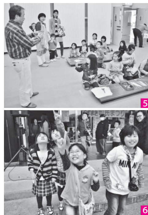
5 古河市教育委員会による「ちびっ子化学実験」。ストローでブービー笛を作る教室 6 空高く飛び上がったロケットを見つけ、指さしながら大喜ぶ子どもたち