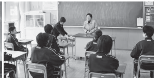
健康で明るい生活を送ってほしいと生徒に呼び掛ける会員