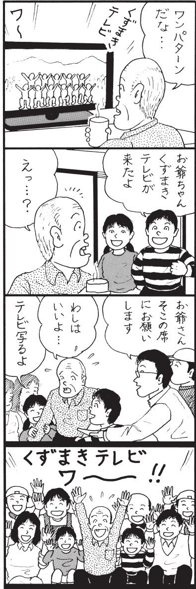
お爺ちゃんが一番はりきっていました