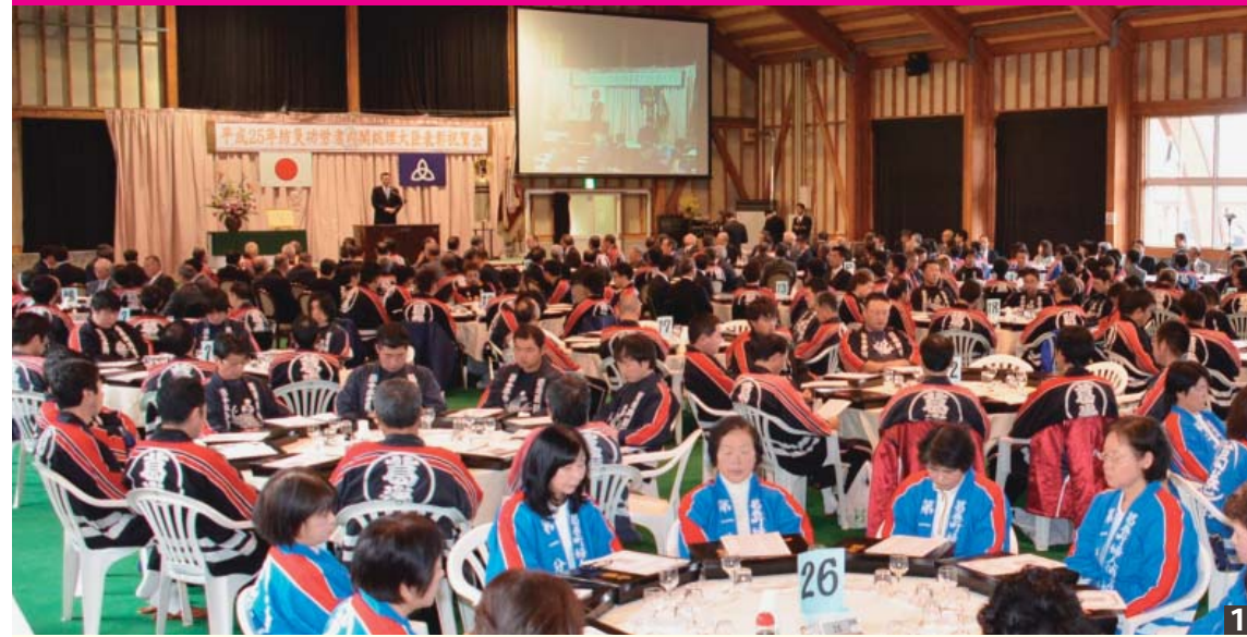
1 消防団員や婦人消防協力隊など関係者約370人が出席した会場 2 婦人消防協力隊の参加者全員によるアトラクション 3 力強い太鼓で受賞を祝う馬淵川源流太鼓の会