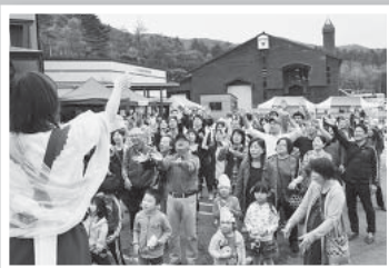
(11) 平成25年11月1日・広報くずまき