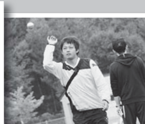
広報くずまき・平成25年11月1日 (10)