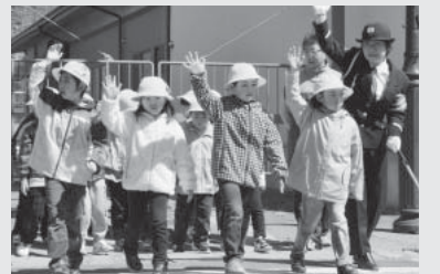
交通安全教室 (葛巻小)