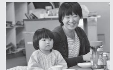
子育てサロン (保健センター)