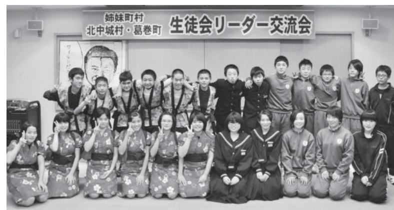
生徒会リーダー交流会に参加し、親睦を深めた北中城村と町内の中学生たち