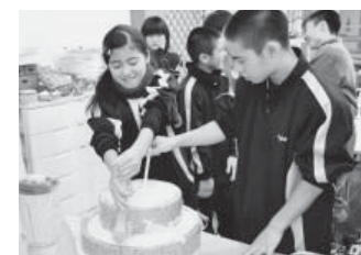
みんなで協力して豆腐づくりに挑戦

1月9日から12日まで、姉妹村の沖縄県北中城村から中学生12人と引率者4人が訪れ、町内の中学生と交流を深めたほか、そば打ちやスキー、酪農体験などを行いました。