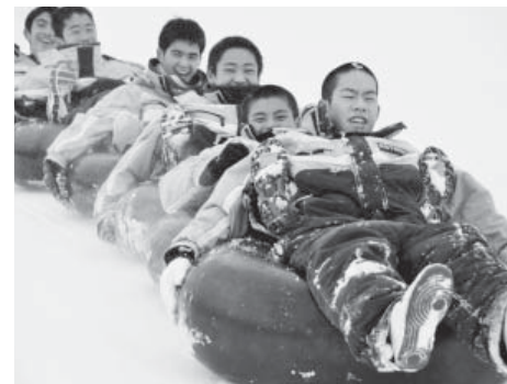
スリル満点のタイヤチューブソリ滑りに絶叫