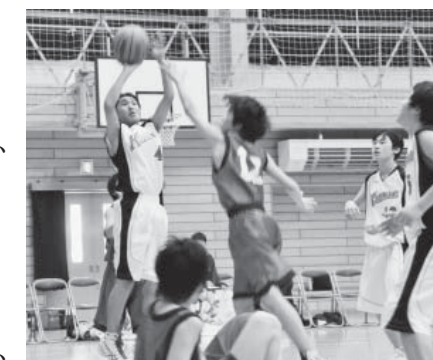
相手マークをかわしてジャンプシュート

被災地から山田中、女川一中(宮城)、五橋中(宮城)の男女4チームを招待し、町が宿泊費などの一部を補助。12日夜には記念祝賀会が開催され、各チームの指導者など関係者110人が開催20回を祝いました。