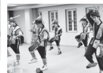
郷土芸能エイサーを披露する北中城の中学生