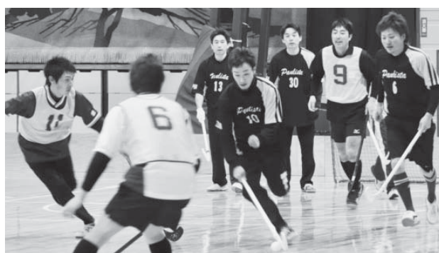
総合優勝をかけた熱戦が展開されたネオホッケー競技

本年度の総合優勝の栄冠は、前期競技から終始首位をキープした中部A地区に輝き、一年間の体育大会に幕を下ろしました。