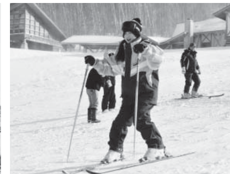
初めてのスキーにおっかなびっくり

1月10日は、町内3中学校の生徒とリーダー交流会を行い、森のこだま館でそば打ちと豆腐作りに挑戦。午後にはグリーンテージに会場を移し、各中学校で取り組んでいる活動を発表しました。 翌11日には、平庭高原スキー場でスキーを体験。最終日の12日は、くずまき高原牧場で、アイスクリーム作りや仔牛の餌やり、タイヤチューブソリ滑りを行いました。 北中城村の中学生たちは、初めて見る雪に感動したり、沖縄より20度以上も気温が下回る寒さに驚きながら、北国の冬を満喫していました。 北中城村と本町との交流は昭和60年に始まり、隔年ごとに互いの町村を訪問。今年の夏には、葛巻から中学生が訪問する予定です。