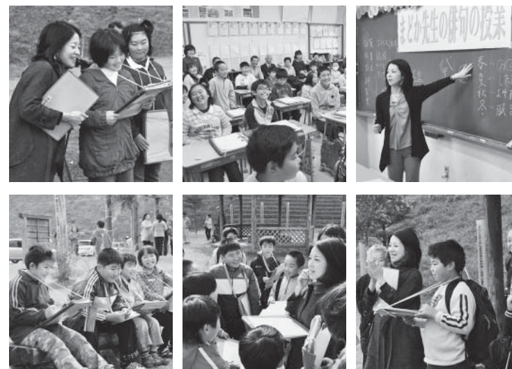
俳句の授業の様子（会場：小屋瀬小学校・道の駅くずまき高原）

「黛まどか先生の俳句の授業」は10月21日、小屋瀬小学校と道の駅くずまき高原で開催され、小屋瀬小学校と吉ヶ沢小学校の児童ら22人が参加しました。 小屋瀬小学校で、俳句の大切な性質である定型（五・七・五）や季語について、黛さんから分かりやすい説明を受けた後、道の駅に移動して俳句の作成にチャレンジ。この日は肌寒い一日でしたが、黛さ