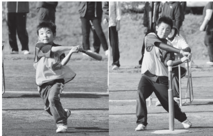
1点差の接戦となった江刈A対江刈Bの決勝戦（ティーボール）