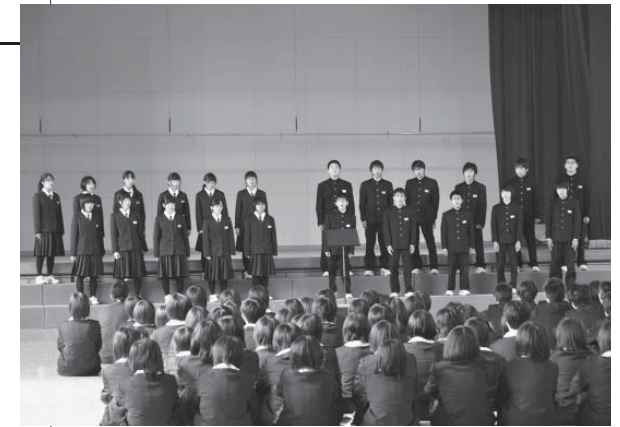
合唱「マイバラード」を披露する小屋瀬中の生徒ら

町の3中学校は田野畑中学校を迎え10月10日、葛巻中学校体育館で「交流会」を行い合唱を通して交流を深めました。この交流会は復興を担う世代としてお互いの絆を深めようと企画され、4校の全校生徒と教員など約300人が参加、互いに学校紹介や合唱を披露しました。 このほか葛巻中は体育祭などの行事で集めた募金を、江刈中はメッセージを書いた色紙と学校で育てたカボチャやサツマイモなどの野菜を田野畑中へ贈りました。田野畑中は感謝の気持ちを込め、3中学校にそれぞれエールを送りました。