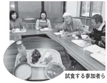
試食する参加者ら

学校給食センターは沖縄食材を使用した給食を10月25日に実施、あわせて一般町民を対象にした試食会を同センターで開催しました。今回の沖縄食材はアーサーという海そうや冬瓜などがみそ汁に使用され、試食した参加者らは「とっても食べやすく、おいしいですね」と話しました。この沖縄との食材交流は年3回行われており、本町からは今回「すいとん」や「いなぎみ」などの雑穀を送りました。