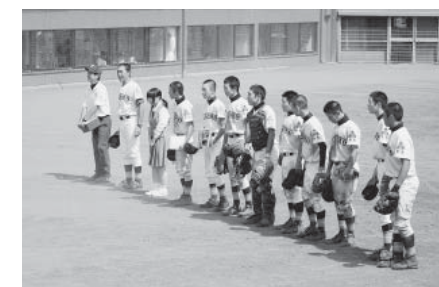
敗者復活戦で3連勝し、県大会への切符をつかんだ葛高ナイン

9月15日に行われた県大会の初戦は盛岡三。健闘およばず8対1の7回コールドで初戦敗退となりました。