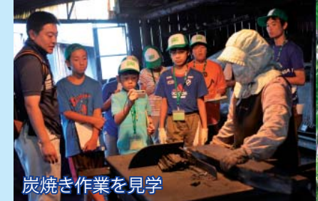
炭焼き作業を見学