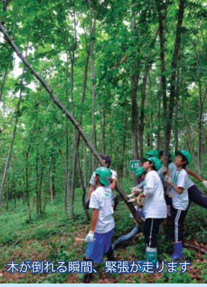
木が倒れる瞬間、緊張が走ります