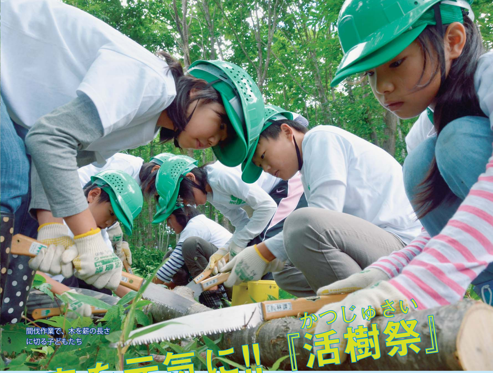
間伐作業で、木を薪の長さに切る子どもたち