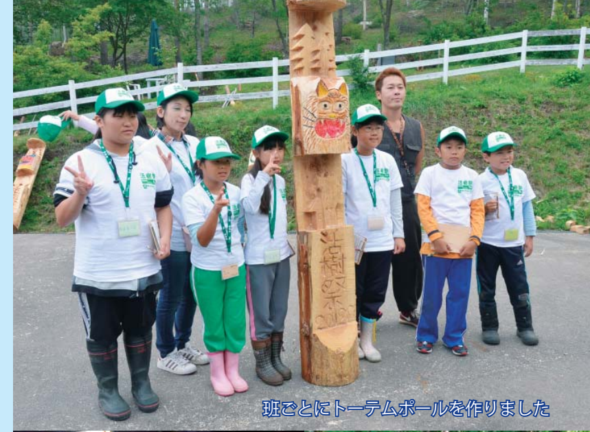
班ごとにトーテムポールを作りました

講師:北海道大学客員教授 (前旭山動物園園長) 小菅 正夫氏 「行動展示」という画期的な動物の展示革命により、廃園の危機にあった旭山動物園を日本一の入園者数へ、また日本一環境の良い動物園と言われるまでに成長させた、その奇跡をひもとく。 日時:9月25日(火)15時～ 場所:グリーンテージ 参加費:無料 申込み:9月14日(金)まで 懇親会:講演会終了後に開催。会費一人1,000円。 〓総務企画課総合政策室 (☎66-2111内線225)