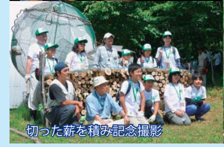
切った薪を積み記念撮影