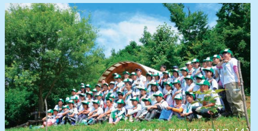
広報くずまき・平成24年9月1日 [4]