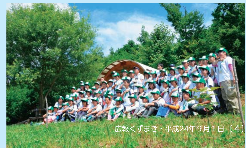
広報くずまき・平成24年9月1日 [4]

京(東京都江東区)と環境NPO「オフィス町内会」が主催、町森林組合が全面的に協力しました。「植樹祭」や「育樹祭」は各地であります。が、「活樹祭」は全国でも初めての試み。この第1回目の活樹祭の記念に、班ごとにチェーンソーアートで製作したトーテムポールをこだま館の横に建てました。