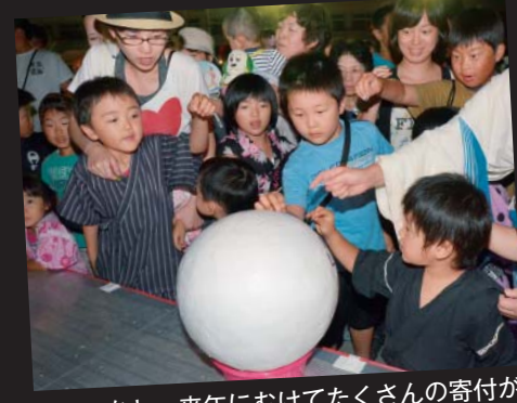
花火のあと、来年にむけてたくさんの寄付が