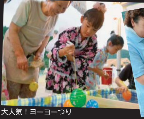
大人気！ヨーヨーつり