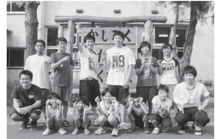
「夏休みお楽しみ会」で交流を深めた参加者の皆さん