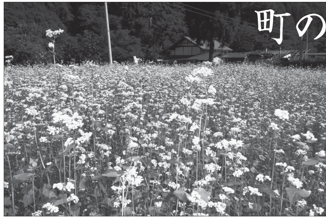
遊休農地を活用し作付けしたソバ (名前端地区)

農業委員会の業務に関する ことは、担当地区の農業委員、 または農業委員会事務局 (☎ 66-2111 内線250・251) へ お問い合わせください。