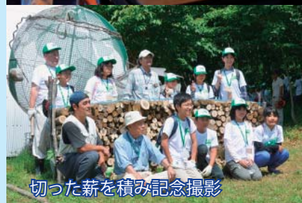
切った薪を積み記念撮影