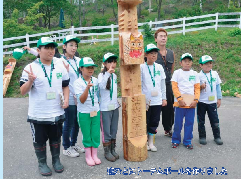
班ごとにトーテムポールを作りました

講師:北海道大学客員教授 (前旭山動物園園長) 小菅 正夫氏 「行動展示」という画期的な動物の展示革命により、廃園の危機にあった旭山動物園を日本一の入園者数へ、また日本一環境の良い動物園と言われるまでに成長させた、その奇跡をひもとく。 日時:9月25日(火)15時～ 場所:グリーンテージ 参加費:無料 申込み:9月14日(金)まで 懇親会:講演会終了後に開催。会費一人1,000円。 ☎総務企画課総合政策室 (☎66-2111内線225)