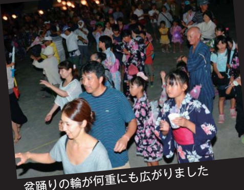
盆踊りの輪が何重にも広がりました