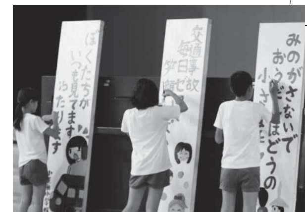
看板に最後の筆入れをするリーダーたち

集会では3枚の大きな看板がお披露目され、看板を作った各班のリーダーが最後の筆入れを行いました。そのうちの1枚が校庭に面した歩道のネットフェンスに設置されると、児童や集会に参加した父兄からは、喜びの声が上がっていました。