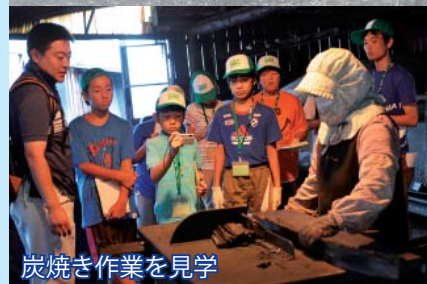
炭焼き作業を見学