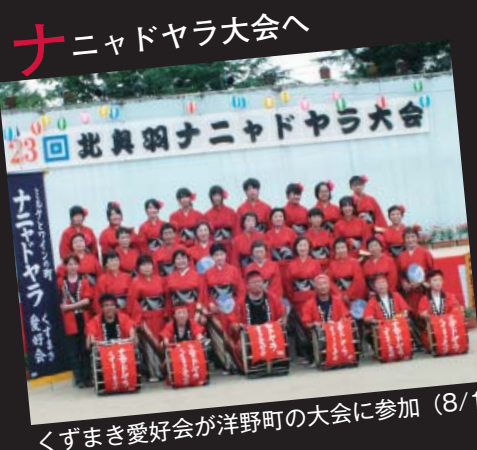
ニャドヤラ大会へ くずまき愛好会が洋野町の大会に参加 (8/18)