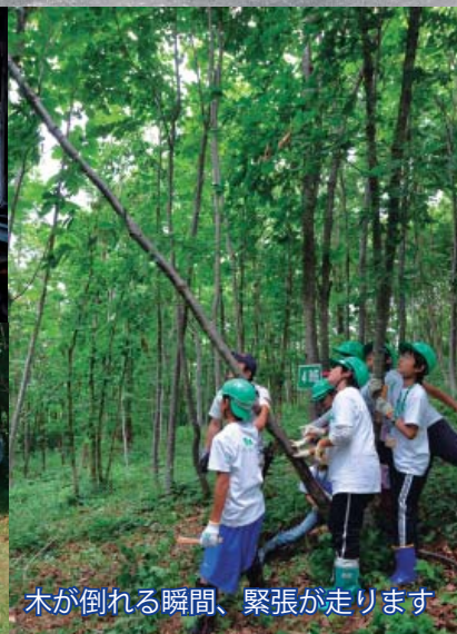
木が倒れる瞬間、緊張が走ります