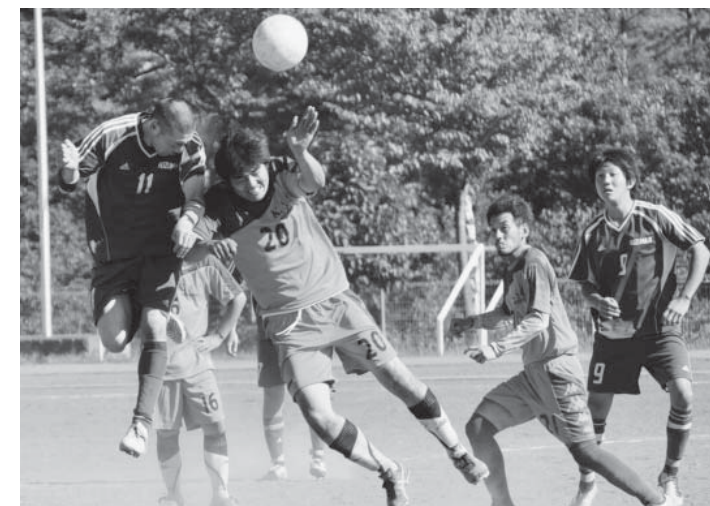
ゴール前での激しい攻防(体協選抜vs葛巻クラブシニアの決勝戦)

毎年恒例の町民サッカー大会は8月19日、町総合運動公園グラウンドで行われました。大会には、町内の中高生や社会人7チーム103人が参加。真夏の日差しが照りつける猛暑の中、熱戦が繰り広げられました。昨年と同じカードとなった決勝戦は、体協選抜が1対0で接戦を制し、2連覇を達成しました。大会の結果は、下表のとおりです。