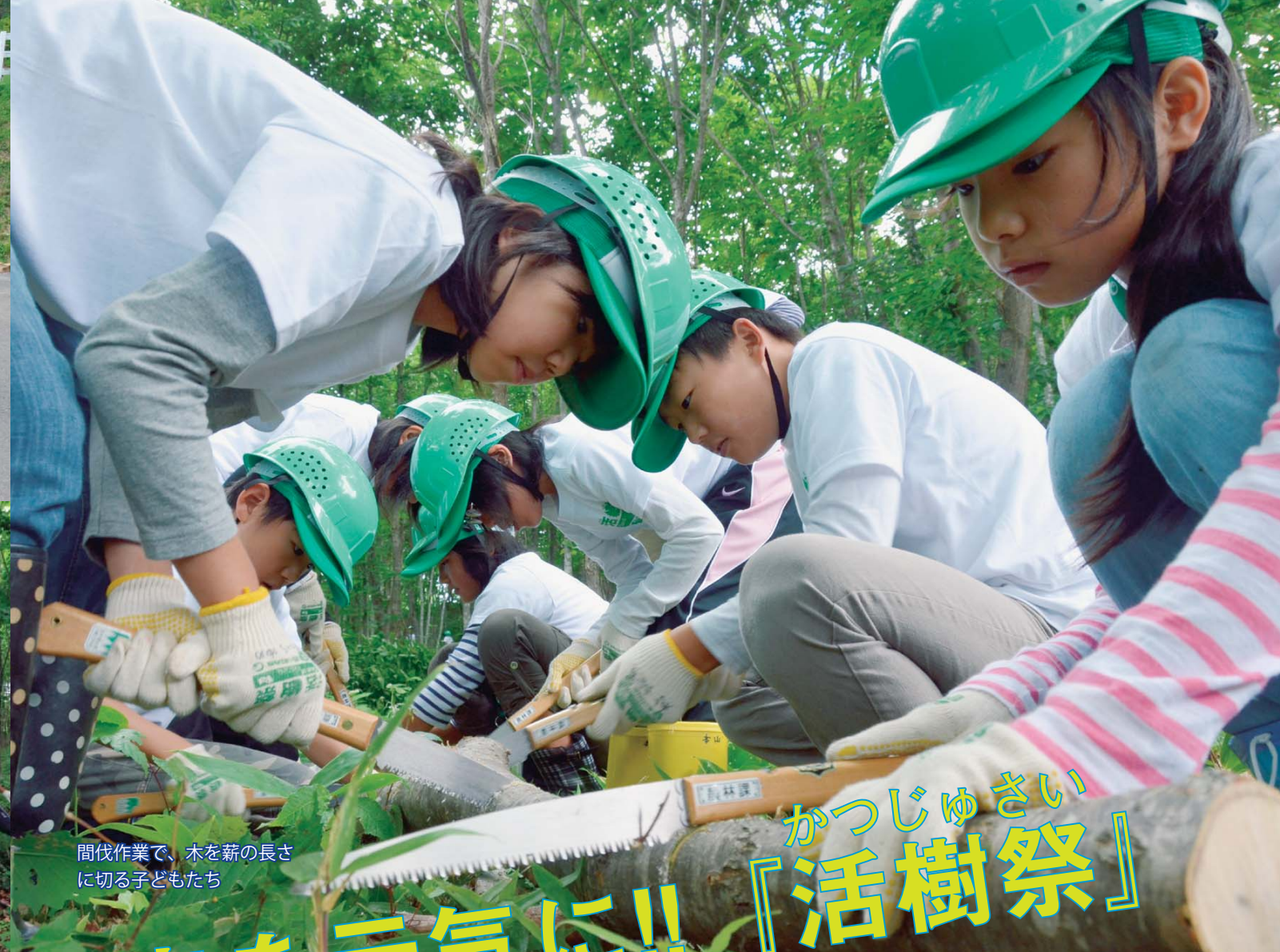
間伐作業で、木を薪の長さに切る子どもたち