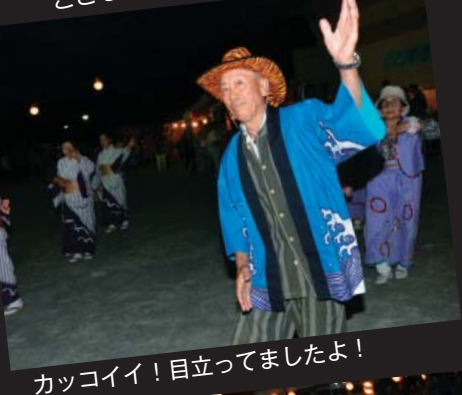
カッコイイ！目立っていましたよ！