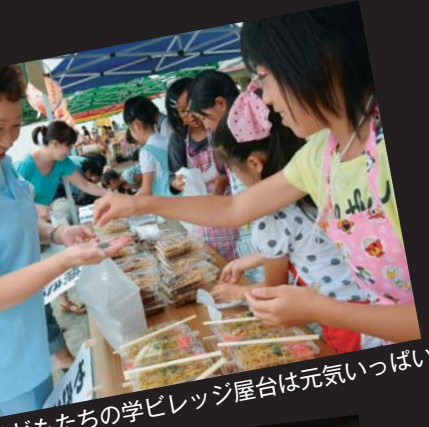
こどもたちの学ビレッジ屋台は元気いっぱい