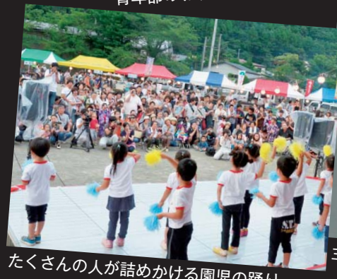
たくさんの方が詰めかける園児の踊り