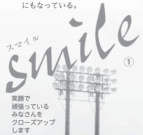
笑顔で頑張っているみなさんをクローズアップします

都市対抗野球は年に1度の社会人野球の祭典で「都市＝市や町村」代表として全国から予選を勝ち抜いた32チームが出場。郷土芸能などのステージ発表や地域の特色を生かした大応援団など、華々しいイベントにもなっている。