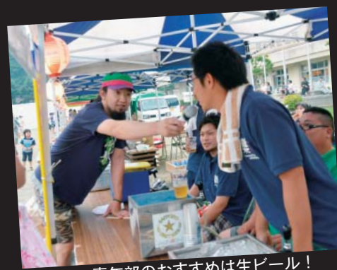
青年部のおすすめは生ビール！

まちなか活性化協議会主催の「くずまきワイン&生ビールまつり」は7月28日、JRバスくずまき駅構内で開催され約1,000人が訪れました。今回、「エクストラコールドカー」が会場へ駆け付け、-2℃のアサヒスーパードライを求めて長蛇の列ができ、この日消費されたビールは551ℓ、過去最高の量となりました。おなじみとなった「Tommy's Club Band」のライブなど参加者は真夏の暑い一日を楽しみました。