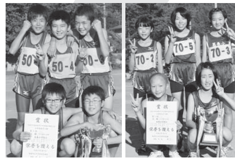
小学校男子 葛巻小A 小学校女子 葛巻小A