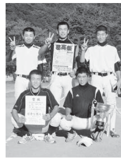
高校・一般 葛巻高野球部A