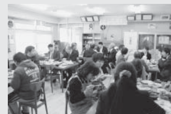
すずらん工房「就労継続支援B型」がスタート(4/1)