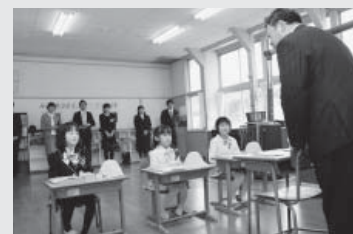
なかよし三人娘、江刈小学校入学式(4/7)