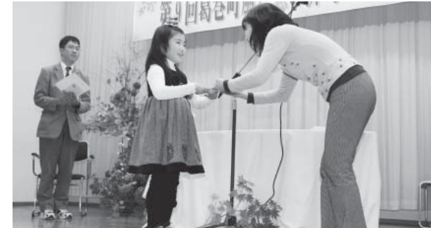
昨年の表彰式の様子

「葛巻町風と恋の俳句コンテスト」は今年、第10回を迎えます。これまで、全国各地や遠くはブラジルやアメリカなどからも投句がありました。全国規模のコンテストは単年度開催が多いのですが、葛巻は長く続けたことにより全国へのアピールと文化の向上に役立ったと思われます。ご協力いただいた多くの皆さまのおかげです。