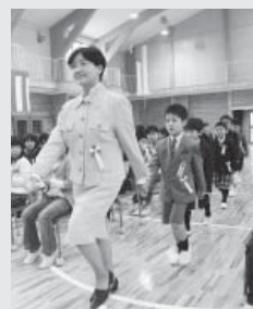
びかびかの体育館で葛巻小学校入学式(4/7)