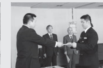
葛巻分署員へ併任発令の辞令交付(4/1)