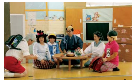
葛巻小の総合学習で介護劇を披露しました

認知症サポーターとはどんな人? 認知症の人の「応援者(サポーター)」のことです。特別なことをする人ではなく、認知症について正しく理解し、認知症の人やその家族を温かい目で見守る人のことです。 当町でも766人(平成22年9月末現在)のサポーターが、認知症の人やその家族の応援者として活躍しています。 皆さんの地区や団体で学んでみませんか?