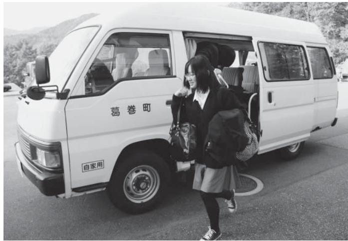
送迎バスから降りる町外から通学する生徒

す。岩泉町から通学している1年の男子生徒は「部活動まできちんと帰るので、とても助かっています」と話します。また、通学手段の確保のため、町内では西部方面、北部方面から町のスクールバスを利用して生徒が通学しています。