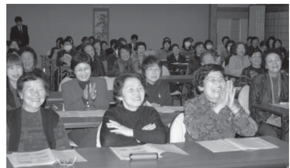
佐々木先生の「女性が元気いっぱいになる話」に会場は元気な笑い声の連続

参加者たちは、女性ならではの視点からまちづくりに参画し、より良い社会にしていこうことを誓いました。