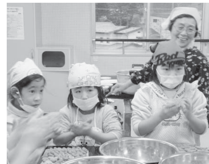
てきぱきと、へっちょこだんご作りに挑戦する子どもたち