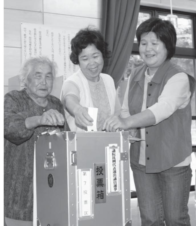
一票に願いを込めて投票する有権者（夢見る里ふれあい交流館：垂柳）