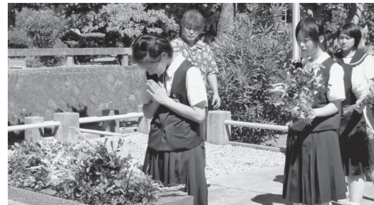
平和への願いを込めて花を供える参加者(岩手の塔)

体験学習や食事会などで、地元中学生と交流を深めた参加者たちは、葛巻から遠く離れた沖縄でかけがえない友情を育みました。