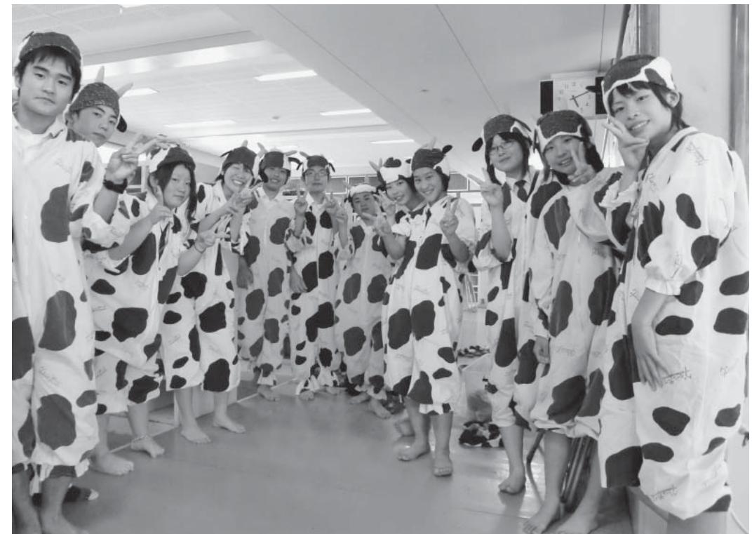
北中城中学校での交流会では12人全員で「モウモウ音頭」を披露

7日だけのローリー 片山 健 著 ある日、家の外に繋がれていた見なれない犬。飼い主が見つかるまで世話をすることになった、ある家族と一匹の犬の七日間のふれあい。