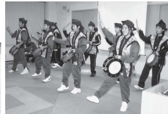
沖縄の郷土芸能「エイサー」を披露する北中城中の生徒たち