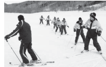
初めてのスキーにおっかなびっくり