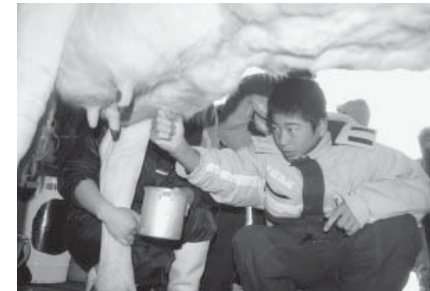
くずまき高原牧場では搾乳にチャレンジ

一月八日には、町内三中学校の生徒とリーダー交流会を行い、森のこだま館でそば打ちと山ぶどう染めに挑戦。午後からはグリーンテージに会場を移し、レクリエーションでさらに交流を深めた後、それぞれの学校で取り組んでいる活動の様子を発表しました。 翌九日は、平庭高原スキー場でスキーやスノーモービルを体験。転びながらも初めてのスキーに汗を流していました。 最終日の十日は、くずまき高原牧場で、アイスクリーム作りや搾乳体験を行いました。初めての大雪と、沖縄より二十度以上も気温の下まわる寒さに驚きと歓声が上がっていました。