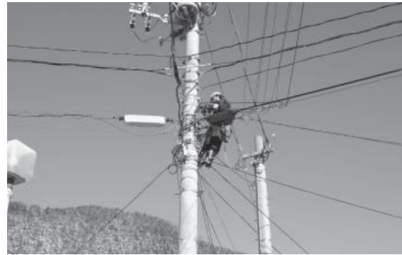
町内で進む光ファイバの架設工事

町民の皆さんが地デジを視聴するため、町は皆さんからの加入申込みを受けて光ファイバを利用してテレビ放送を各家庭に再送信することになります。 さて、一番気になるのは「お金はどのくらいかかるの？」光ファイバを引き込むこと、テレビなどの準備、ブロードバンドも受けたい、テレビ組合は……。といったどのくらいかかるのか、現時点でお知らせできる範囲で、皆さんの疑問にお答えします。