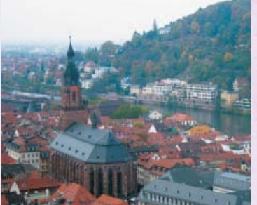
歴史あるバードデュルクハイム市の街並み

そのとき一番大事なことは何かを考えて行動に移すことが大事です。今年一年、思い残すことのないよう、一生懸命こなしていきたいです。