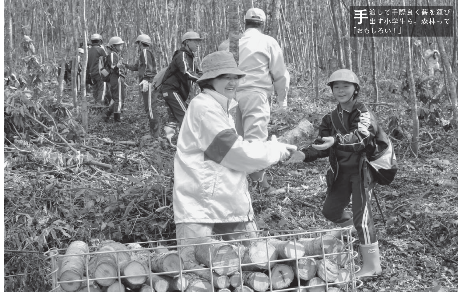
手 渡して手際良く薪を運び出す小学生ら。森林って「おもしろい！」