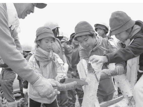
丸 太切りに汗を流す児童ら。力より技が求められる作業で、のこぎりを上手に使って切り落とす