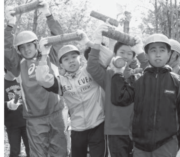
薪 を運び出した後、全員に薪1本づつプレゼント。ずうっと大切な森林を守っていくぞ〜と誓った