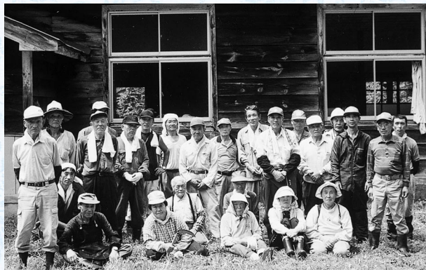
夏の草刈り作業後、旧毛頭沢分校前に集合した会員