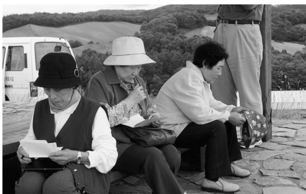
東屋で句をひねる参加者の皆さん

俳句の面白さを学んだ後、牧場内を吟行。参加者らは、句の題材に満ちあふれた自然を背景に句作に挑みました。