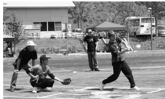
熱戦が繰り広げられた390歳ソフトボール競技 好球必打！高速スイングでバットが見えませぬ

前期競技が終わった時点での総合成績は、二種目で優勝を飾った中部Aが一步リード。次いで西部が追いかける展開となっています。