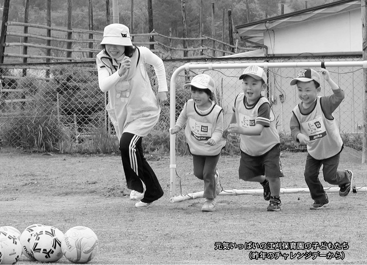
元気いっぱい江刈保育園の子どもたち (昨年のチャレンジデーから)