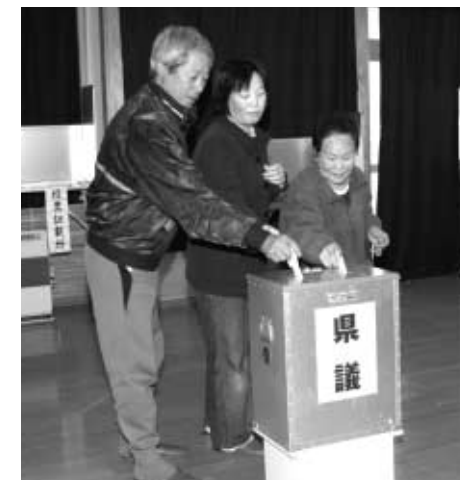
4月8日執行の県知事・ 県議選での投票風景（新 町自治会館）