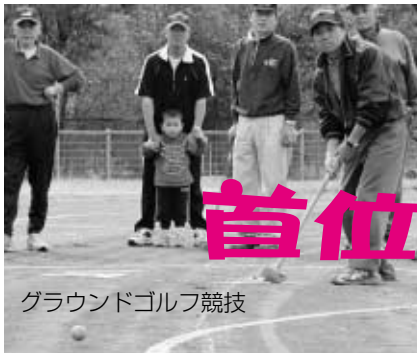
グラウンドゴルフ競技