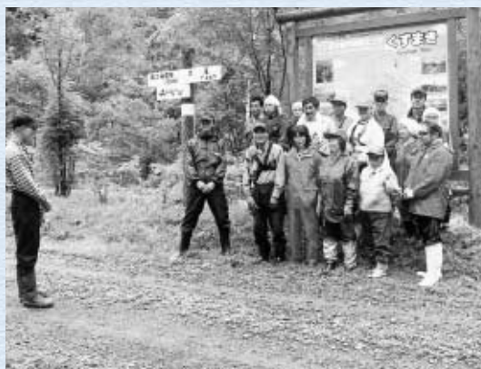
◇文・写真 自治会提供