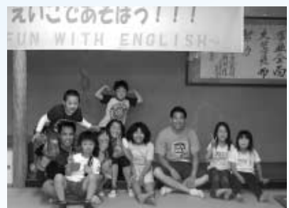
公民館で開かれた第1回の英語教室

どこの国でもそれなりの欠点があって、完璧な国はありません。反対に、もし僕がみんなに「好きな国はどこですか」と聞くと、「自分の国」と答えるに違いありません。イギリス人であれば「イギリス」と、フランス人であれば「フランス」と答えます。つまり、ほとんどの人は自分の国を選ぶということは当然だと思います。