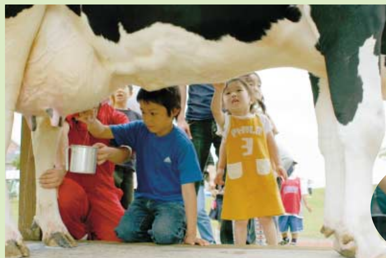
ドキドキ 初めての乳搾り体験で「さわっても大丈夫?」と語りかけるちびっ子

第11回くずまき高原牧場まつりは六月九日と十日の二日間行われ、約三万人の家族連れやくずまきファンでにぎわいました。県内は不安定な天気の中でしたが、まつりの熱気にも遠慮がち。一時的に降っただけで、詰めかけた大勢の人たちはゆっくり流れる時間と動物たちとのふれあいを楽しみました。