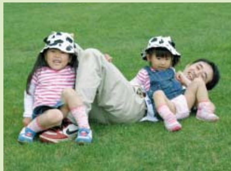
癒やし 緑いっぱい 気持ちいいね