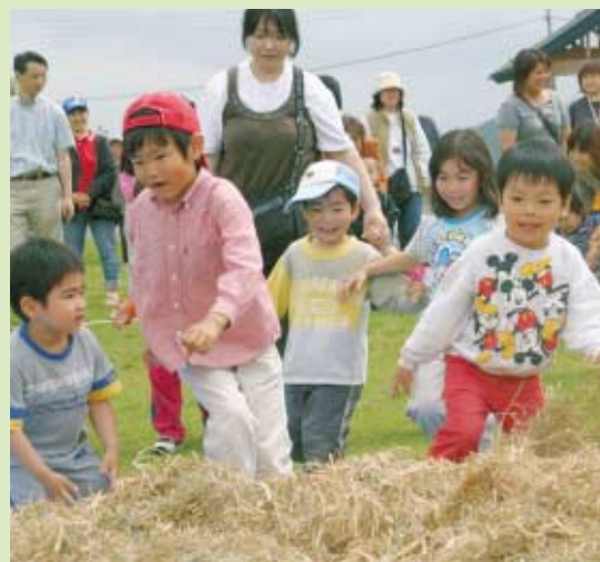
宝 ちびっこ宝さがし大会。一番大きな宝物は、ボクのもの!