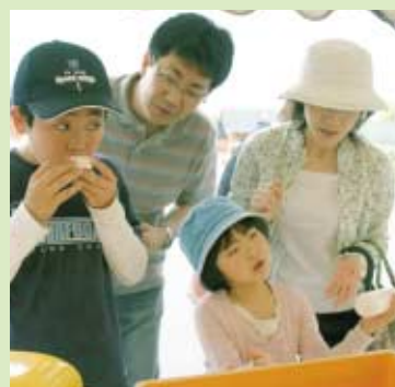
昔懐かしいせんべい焼き体験。iiiiiii