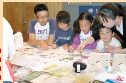
こうすると上手にできるよ！