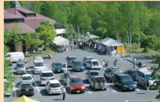
満車 終日満車状態の森の館「ウッディ」会場