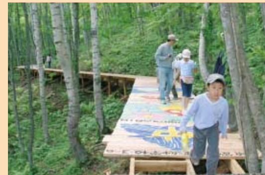
フォレストポード まだまだ続いています