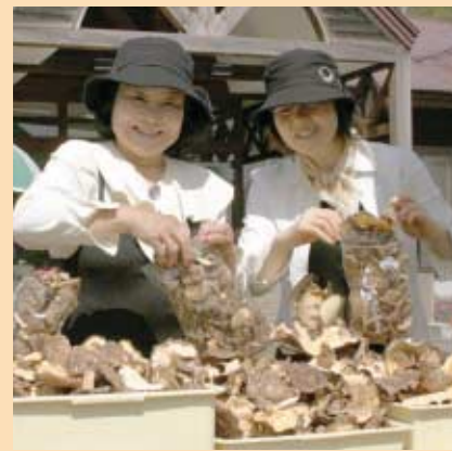
乾燥しいたげ 千円でどのくらい詰め込めるかな「ギョーッと入れてー」