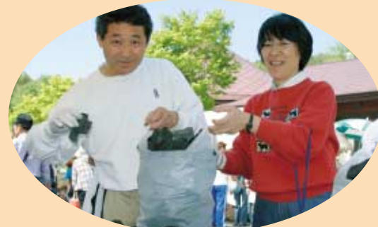
はい、もう少しよ！こちらは300円で炭の詰め放題