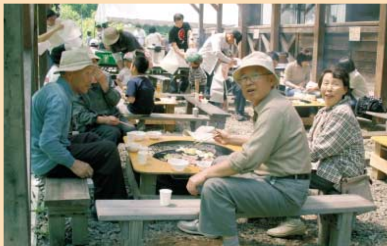
食べ放題 ワインやジュース付き840円食べ放題のジンギスカンまつりは、待ち時間もでるほどの大盛況

本町の初夏を彩る祭典「平庭高原つつじまつり」は6月2日と3日の2日間、この日を待っていたかのような晴天に恵まれて開催されました。 メイン会場となった平庭高原駐車場には海の幸と山の幸がどっさり持ち寄られ、多くの人たちが交流を楽しみました。ツツジの見頃には少し早かったものの、訪れた人々は高原の初夏を存分に満喫しました。