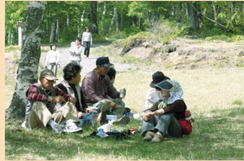
憩う ツツジの開花にはまだ少し早かった平庭高原