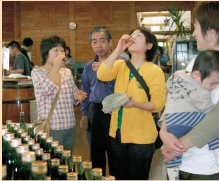
試飲 くずまきワインは大人気