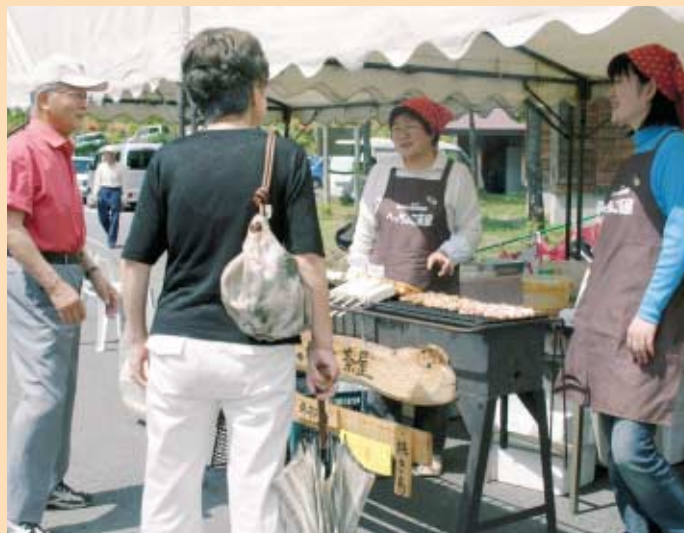
屋台村 昨年が続いて出店した冬部「へっちょこ茶屋」も人気