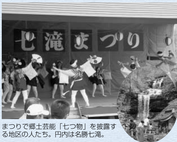
◇文・写真 自治会提供