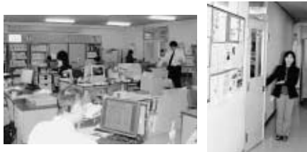
学校教育課と生涯学習課を統合。どうぞお気軽に。