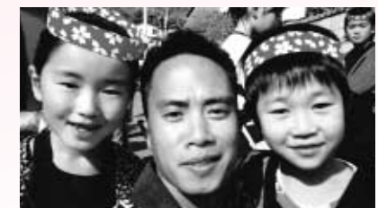
下町組の子どもたちと

下町組では、子どもたちがドラえもん・ダンスを踊りました。時間が進むにつれて、そのダンスに大人もだんだん加わってきました。まだ子ども心が残っていることはいいことだと思います。が、ただお酒のせいかもしれません。いずれにしても、みんなは楽しんでいるのでとってもいいと思います。下町組に参加することができ、本当にありがたいと思います。僕にとっては葛巻にひとつのとてもいい思い出になりました。