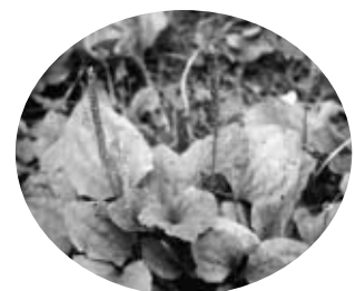
全草は花穂が出るころ採集し、水洗いしてから、日干しで乾燥させます。種子は秋に日干しに。