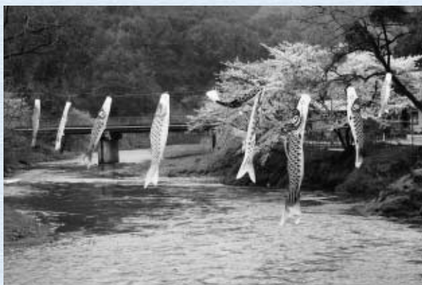
道行く人を楽しませる鯉のぼり