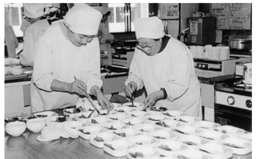
この活動も協働のまちづくりです (配食サービスのボランティア)