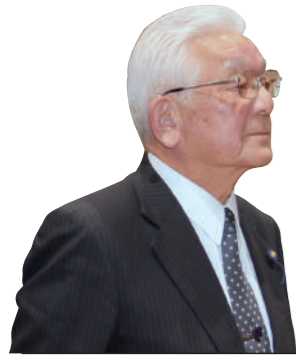
しばた いさお 議員 柴田勇雄