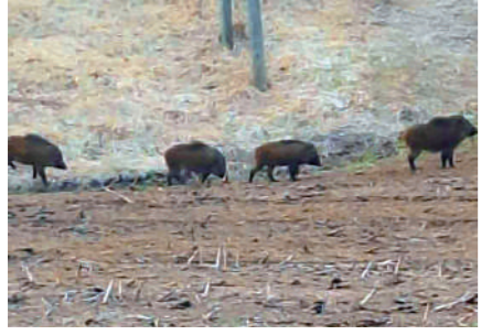
畑に出没したイノシシ(小屋瀬)

答 農林環境エネルギー課長 クマやシカなどの捕獲に対する報奨金を交付し被害防止を図っているが、近年クマの出没や捕獲数が増加しており、危険性や負担を考慮し報奨金を増額する。