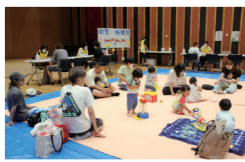
幼児歯科健診の様子