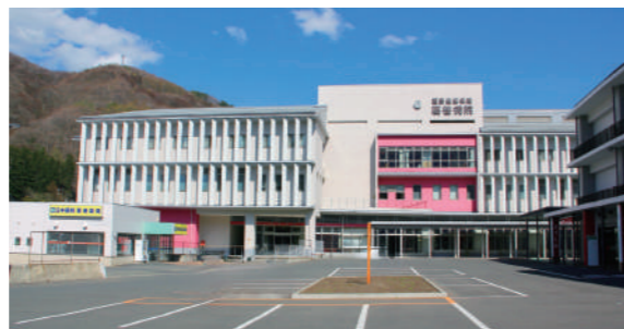
町民の健康を守る葛巻病院

町長 本年2月に中央社会診療医療審議会で具体的な点数等が答申された。薬価改定は4月に、診療報酬と材料価格改定は6月に改定。現在、国・県からの詳細な通知が届いていないことから現時点での影響試算は困難。早期の情報収集に努め、今後の動向に注視する。