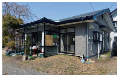
空き家バンクに登録されている住宅

答 地域整備課長 空き家の実態調査を行い、件数や状況を把握するとともに、自治会への聞き取りや所有