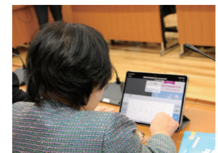
タブレットで資料を閲覧

ことは言うまでもありません。すでに、ICT(情報通信技術)活用が、我々の日常生活にしっかりと溶け込んだ時代に変容していることに遅ればせながら気付きました。