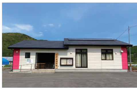
6年度完成の山岸自治会館

答 まなび交流課長 燃料費などの価格高騰により維持管理費が増加しているため、指定管理料を増額する。均等割分3万円に施設面積に応じて面積割分を加算。これまでと比較し2万3000円〜4万5000円円の増額となる。 自治公民館については年額2万円を4万4000円に増額する。