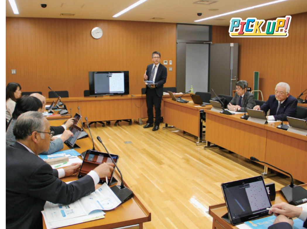
講師からの説明を聞きながらタブレットを操作する議員