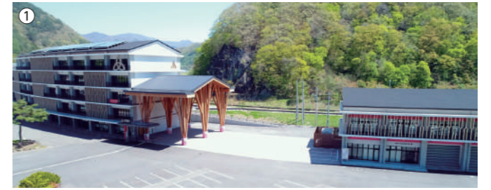
全施設が完成した「くずま〜る」(①)と町産材が利用された「びっくテラス」(②)

子育て支援や高齢者支援、産業振興、地域交通や教育など、各分野の施策を進め、全施設が完成した複合庁舎「くずま〜る」の活用による地域活性化にも取り組み、町民が安心して暮らせるまちを目指した内容となっている。