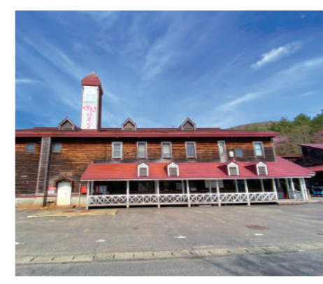
老朽化したワイン工場