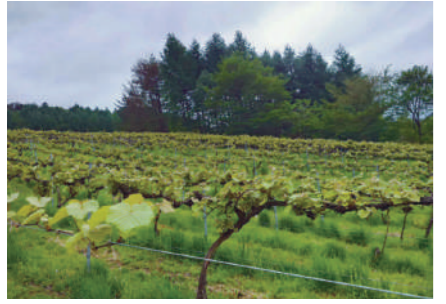
山ぶどう園場(鍋倉地区)

答 農林環境エネルギー課長 町の特産品であるワインの原料となる山ぶどう等の安定確保を図るため(株)岩手くずまきワインが購入した原料購入費の一部を支援するもの。 生産者の高齢化や資材高騰、気候変動により原料確保が不安定となっていることから、生産者の栽培継続と原料供給の安定を図り、町の基幹産業であるワイン産業を将来にわたり維持することを目的としている。