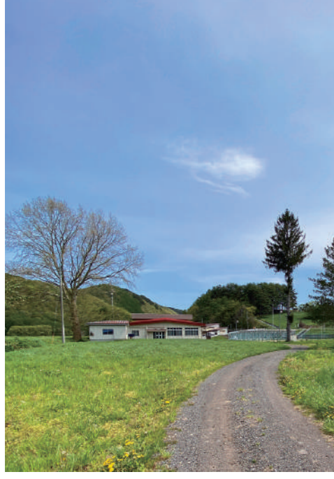
町道江刈農村センター線

答 地域整備課長 国道340号線から江刈中学校に向かう町道四日市中村線の小苗代橋の手前から江刈農村センターへ向かう道路であり、幅員が狭く、未舗装で暗く危険なため、道路の拡幅や線形改良を行う計画である。