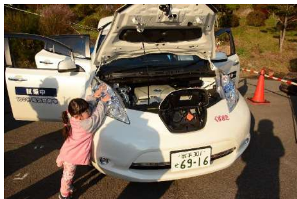
ガソリンを使用しない電気自動車