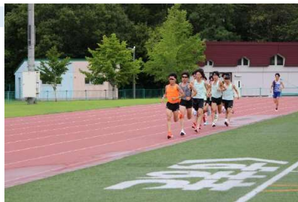
多目的グラウンドで トレーニングする選手たち