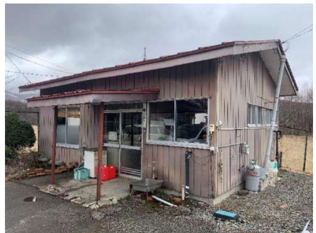
現在のリサイクルセンター休憩所

リサイクルセンターの休憩所について、築年数が50年を経過し、老朽化が激しいため、更新し、従業員の体調不良によるリスク軽減や、生産性の向上を図ります。