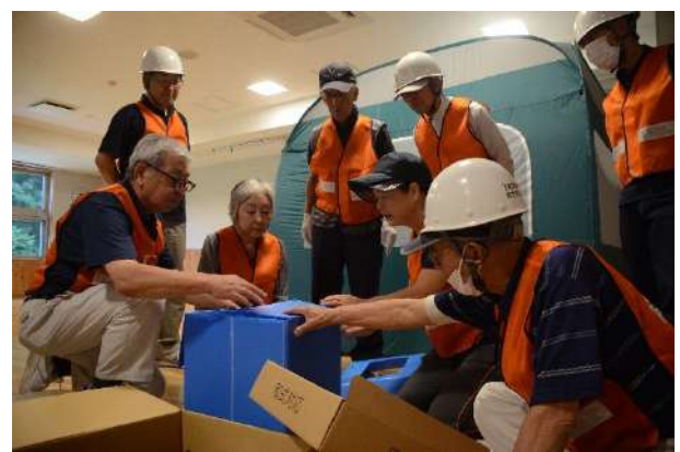
地域住民で協力し有事の際に備える