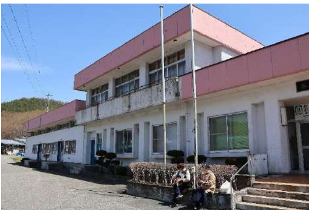
修繕工事を予定している茶屋場自治会館