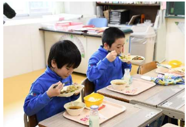
笑顔で給食を頬張る児童