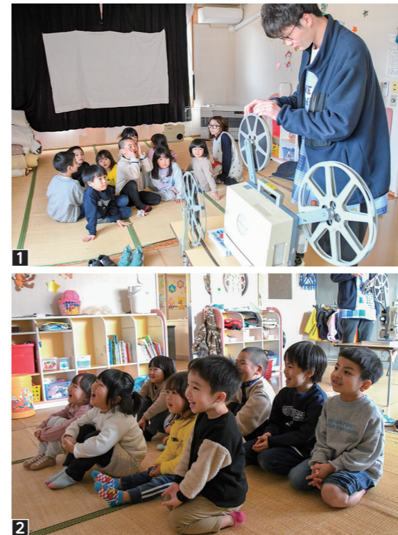
1 園児たちは普段目にするのでできない映写機やフィルムに興味津々2 映写機ならではの雰囲気の中、熱中して鑑賞する園児たち

3月17日から24日までの期間、16ミリ映写機で投影する春季巡回子ども映画会が町内の保育園などを巡回しました。3月17日は江刈保育園で行われ、園児9人が鑑賞しました。園児たちは、映像の長さによってフィルムの大きさが異なることや、手巻きで巻き戻す仕組みなど、普段は目にするのができない映写機やフィルムに興味津々。映写機