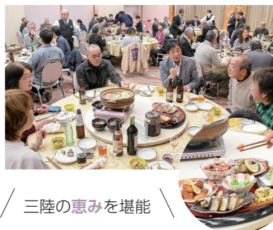
三陸の恵みを堪能

グリーンテージが主催する「第14回三陸の食を味わうタベ」が開催され、94人が出席。三陸に思いを寄せました。