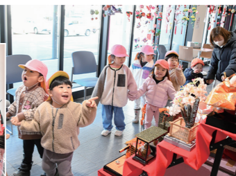
保育園もにっこり

3月1日から3日までの3日間、町商工会が主催する「ひなまつり」が行われ、くずまきをひな飾りが彩りました。