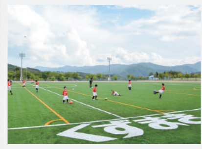
全天候型の陸上用トラックと人口芝 のグラウンドに生まれ変わった