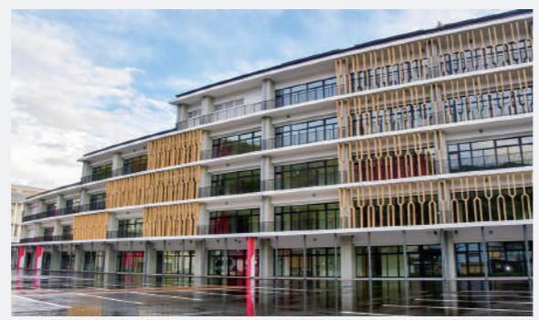
行政・交流・商工・金融の機能を持つ複合庁舎 愛称は「くずま〜る」に決定