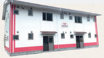
▲安心して産み育てられる まちづくりを推進