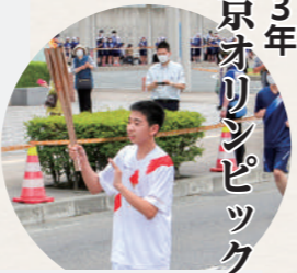
▶町を代表して小屋瀬中の 生徒が聖火ランナーに参加