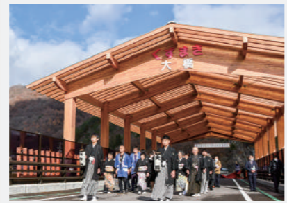
くずまきカラマツ集成材を活用した 木製上屋付きの「大橋」が完成