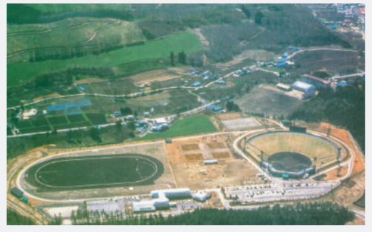
都市との交流促進を図るため、ふれあい 宿舎グリーンテージ、総合運動公園を整備