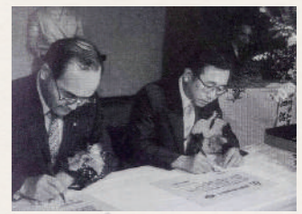
交流事業などを通して 絆は現在も続いている