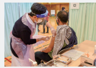
▲若者雇用促進住宅