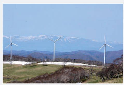
袖山高原の風力発電が本格稼働(令和元年終了) 「新エネルギーの町・葛巻」を宣言した