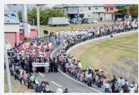
多くの町民が「葛巻音頭」に参加し 開通を祝った記念パレード