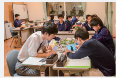
現在は約7割の生徒が利用