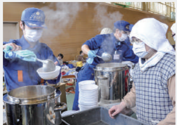
町でも被災地へ出向き 復興に向けた支援を行った