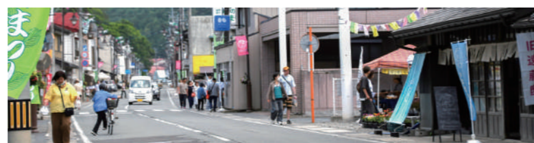
6月8日はまちなかを歩く人でにぎわった

くずまきクラフト市2025みなづき（同実行委員会主催）は、旧遠藤邸を中心に周辺の空き店舗などを活用して開催。町内外の出店者や来場者が訪れ、にぎわいを見せていました。また、6月8日はJRバス葛巻駅構内でまちなか新緑まつり（まちなか活性化協議会主催）も開催され、会場となったまちなかは購入した商品を手にする人が往来するなど、活気に溢れていました。