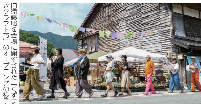
旧遠藤邸を会場に開催された「くずまきクラフト市」のオープニングの様子

町家旧遠藤邸を会場に、5月24日にはさまざまなパン販売店が軒を連ねる「パンの日」、6月7日・8日には町内外の出店者が数多く集まる「くずまきクラフト市2025みなづき」が開催されました。