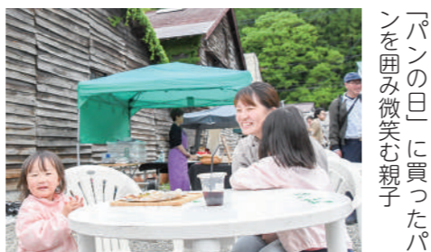
「パンの日」に買ったパンを囲み微笑む親子

パンの日は、株式会社やどり木と起業家育成支援セミナーの卒業生らが企画し、開催は今回で2回目。会場は目を輝かせながらパンを選ぶ来場者や、屋外に設置されたテーブルで購入したパンを囲む親子の姿などが見られ、笑顔に包まれていました。