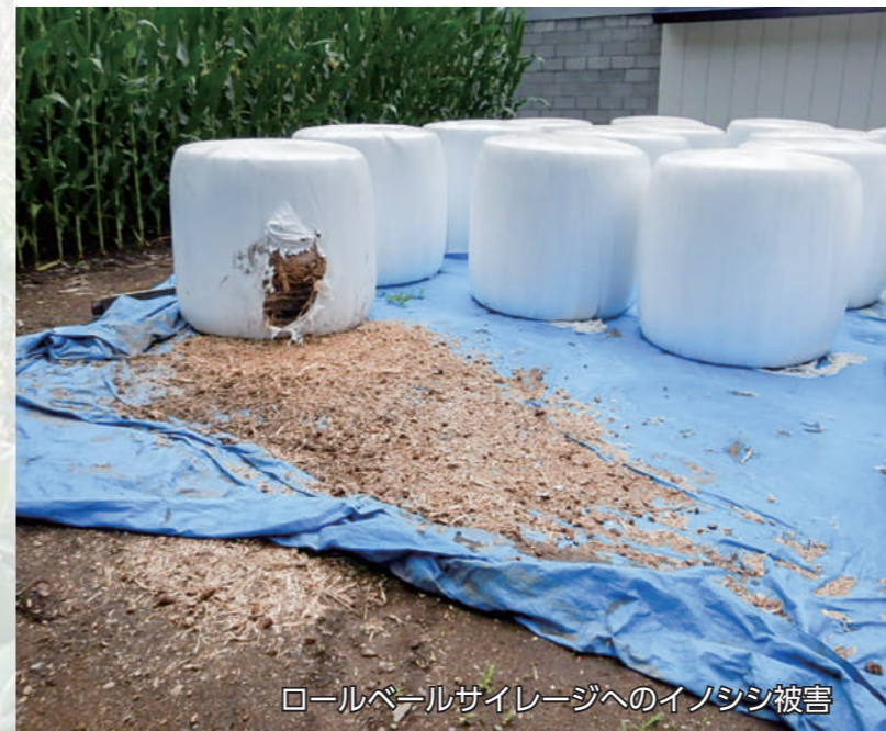
ロールベールサイレージへのイノシシ被害