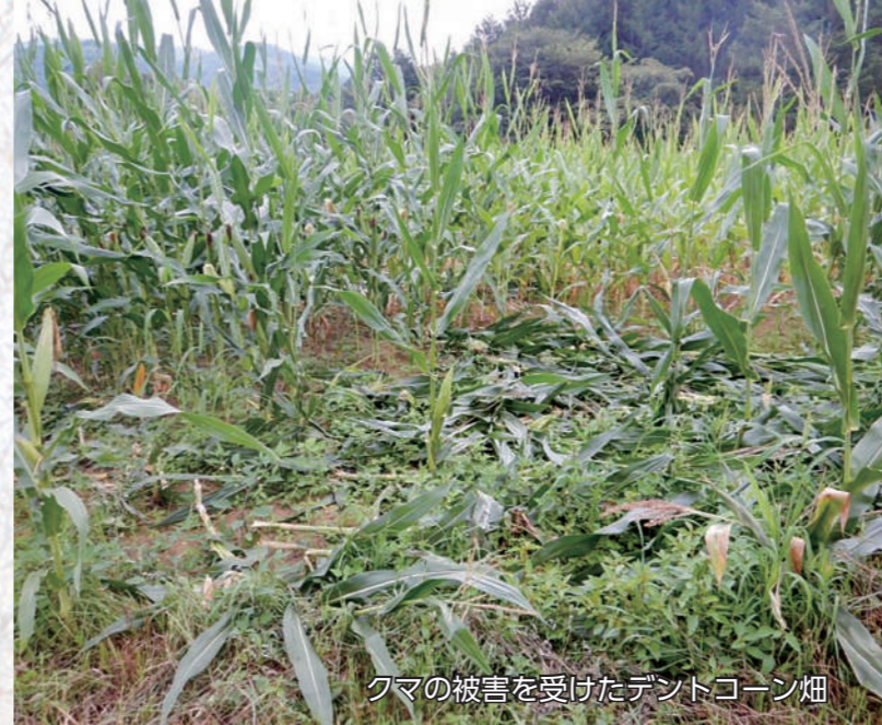
クマの被害を受けたデントコーン畑