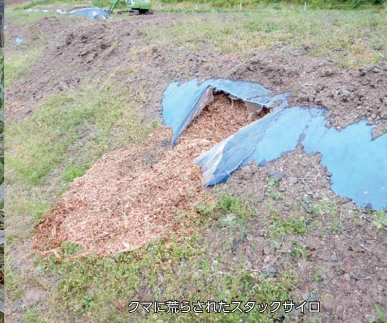
クマに荒らされたスタックサイロ