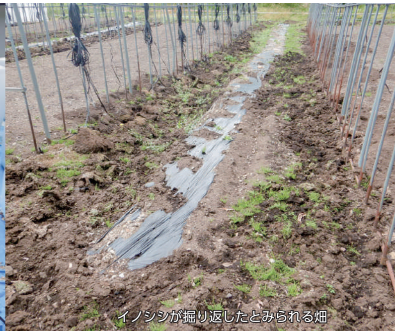
イノシシが掘り返したとみられる畑