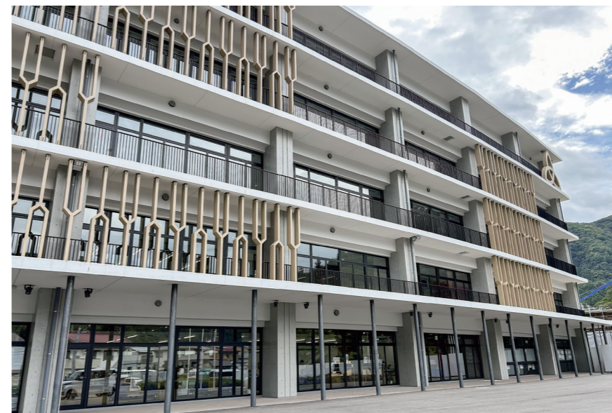
完成した役場庁舎

経営健全化基準は20%未満で、対象となる農業集落排水事業の資金不足は発生していません。