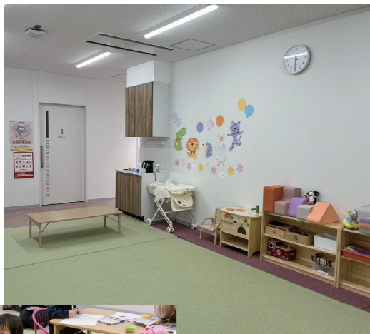
活用が期待される子育てサロン (くずま〜の2階)